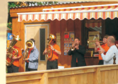
Kiosk "Zur Kanonenbahn"